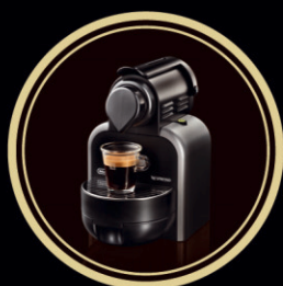
CAFETERA NESPRESSO ESSENZA DELONGHI A PARTIR DE 8.000 € (+ 0,22% TAE)

AHORRO EN IMPUESTOS HASTA UN 45% Y LLÉVESE UN REGALO MUY ESPECIAL, SEGÚN APORTACIÓN.