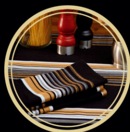
MANTELERÍA 8 SERVICIOS EUSKAL LIGNE A PARTIR DE 5.000€ (+ 0,19% TAE)