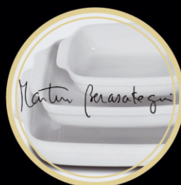
SET . FUENTES HORNO MARTÍN BERASATEGUI A PARTIR DE 3.000€ (+ 0,17% TAE)