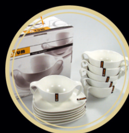
JUEGO CONSOMÉ 6 SERVICIOS A PARTIR DE 1.500€ (+ 0,36% TAE)

*SE GARANTIZA A LOS PARTICIPES QUE EN LA FECHA DE SU VENCIMIENTO, EL DÍA 28 DE JULIO DE 2015, EL VALOR LIQUIDATIVO DE SU PARTICIPACIÓN SERÁ, COMO MÍNIMO, IGUAL AL 110% DEL VALOR LIQUIDATIVO DE LA PARTICIPACIÓN DEL DÍA 31 DE DICIEMBRE DE 2010, FECHA DE INICIO DEL PERIODO GARANTIZADO.